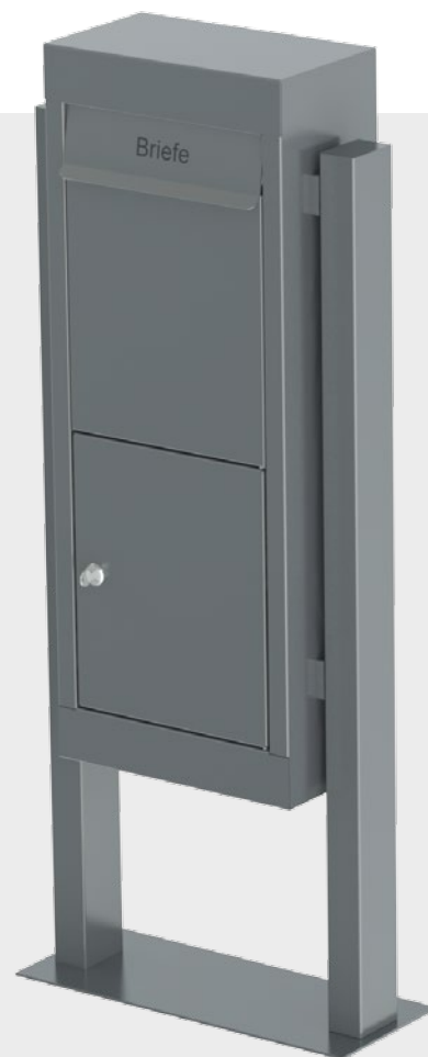
Bestellbeispiel / Exemple de commande S-2090FX

Mit Sicherheit der Richtige! Assurément le bon !